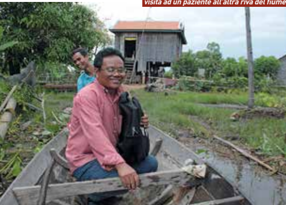
visita ad un paziente all'altra riva del fiume