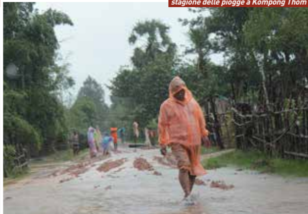
stagione delle piogge a Kompong Thom