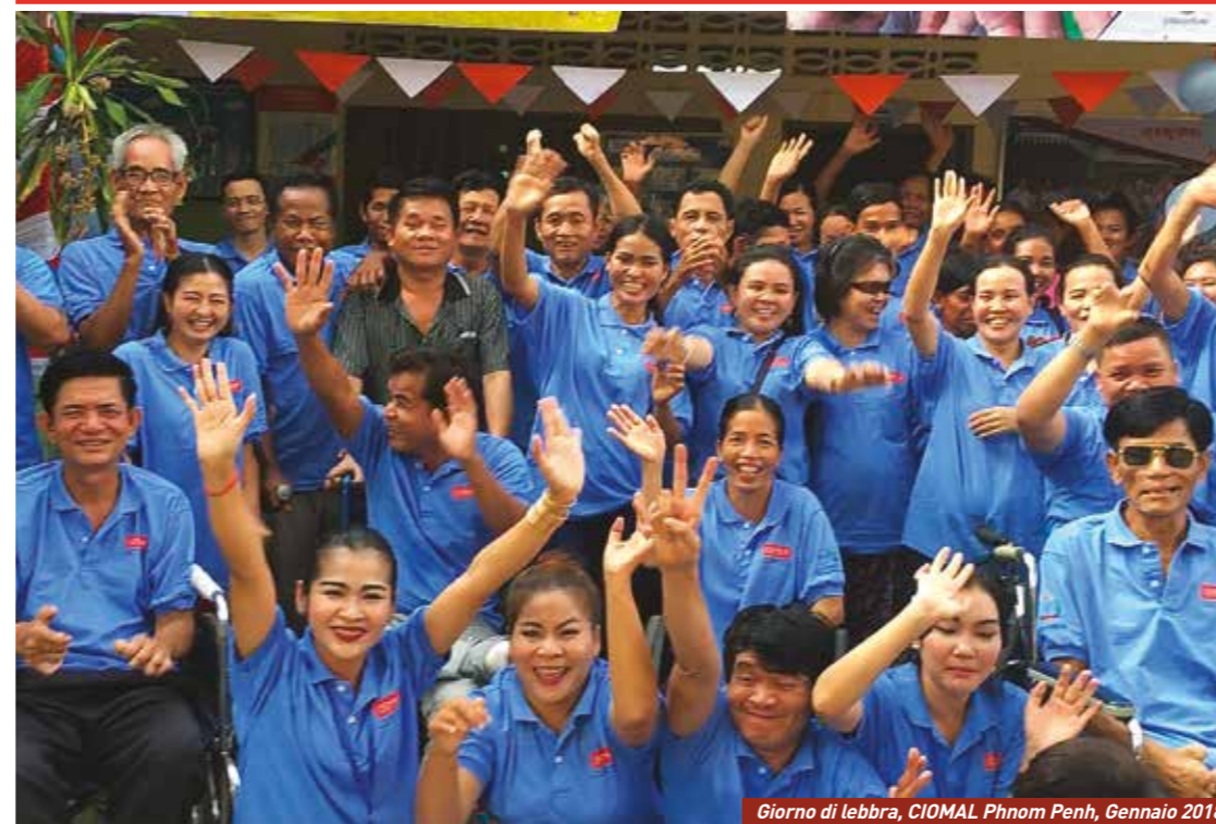
Giorno di lebbra, CIOMAL Phnom Penh, Gennaio 2018

bolletino trimestriale - marzo 2018 - N°138