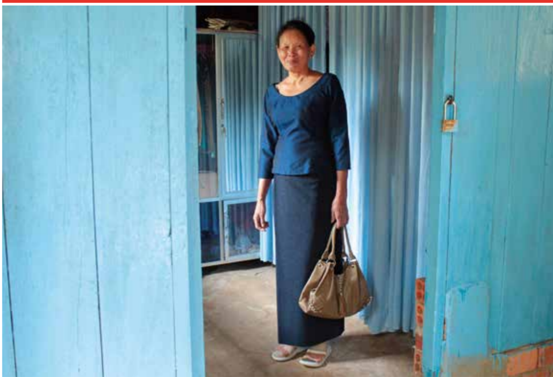
Der Traum in Blau des Frl. Kunthy

Liebe Spenderin, lieber Spender, heute wird die Lepra zu 100% medizinisch behandelt. Dennoch werden die geheilten Personen, welche oft unter bleibenden Beeinträchtigungen leiden, und ihre Familien von der Gesellschaft ausgestossen. Sie verlieren ihre Arbeit, ihr Haus, werden von den Spitälern abgelehnt und die Kinder nicht in die Schule aufgenommen. Diese verschiedenen Ausschlüsse sind schwerwiegende Verletzungen ihrer Grundrechte.